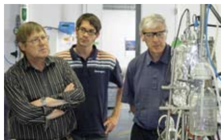
Demonstrationen im Labor zur Sicherheit in Chemie und Biologie

Im Rahmen ihrer Dienstleistungsaufträge bieten die Institute massgeschneiderte Weiterbildungsangebote an. Diese Möglichkeit nutzten die Waagen- und Geräteentwickler von Mettler Toledo, Greifensee.