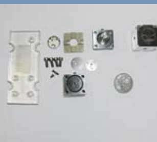
Beispiele und Grössenvergleich von Mikroreaktoren