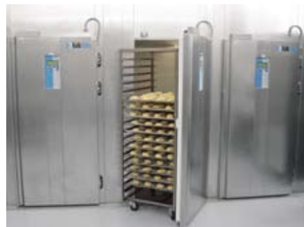
PATT®-Anlage der Firma Kolb Kälte

tionellen. Insbesondere konnten in den PATT®-Produkten mehr malzige, fruchtige und honigartige Aromen identifiziert werden, im Gegensatz zu grünlichen, hefigen Noten bei den herkömmlichen Brötchen.