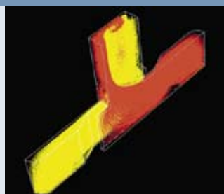
Mischverhalten eines Mikroreaktors