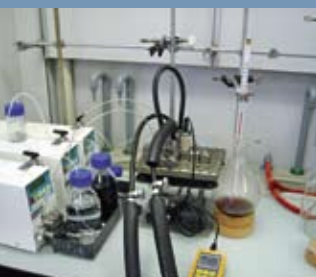
Typischer Mikroreaktor Set-up